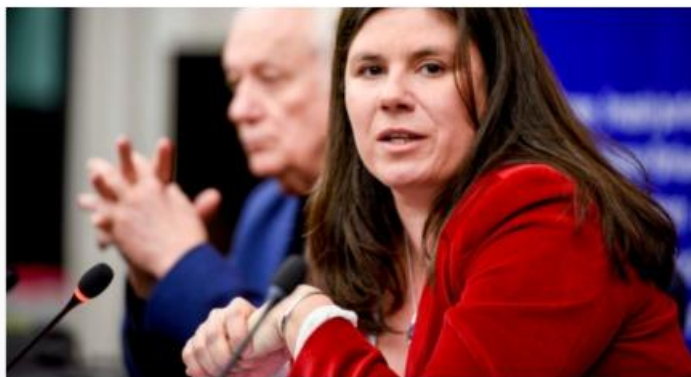
Virginie Rozière during a press conference on whistleblowers